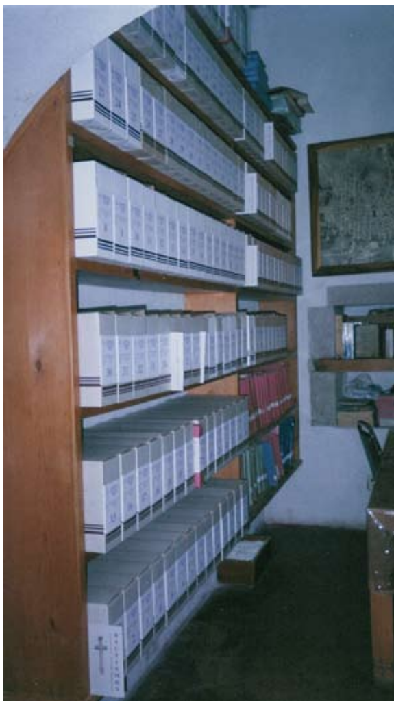
Después del proceso